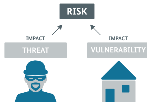
Abbildung 1: Ermittlung des Risikos im Rahmen der Nationalen Risikoanalyse Deutschlands. Analyse der Bedrohung (Threat) und der Verletzlichkeit (Vulnerability).

Die Bewertung des Risikos steht im Rahmen dieser Analyse im Einklang mit den Anforderungen des risikobasierten Ansatzes der FATF-Empfehlung 1. Das Risiko für Geldwäsche und Terrorismusfinanzierung setzt sich daher im Rahmen dieser Untersuchung aus dem jeweiligen Bedrohungspotential sowie der korrespondierenden Verletzlichkeit (bzw. Anfälligkeit) Deutschlands zusammen.